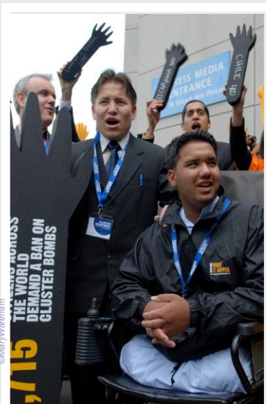
ຜູ້ສະໜັບສະໜູນ ແລະ ຮຽກຮ້ອງການເກືອດຫ້າມລະເບີດລູກຫ່ວານ ທີ່ດູບລິນ ປີ 2008

“ການສະໜັບສະໜູນການເກືອດຫ້າມລະເບີດລູກຫ່ວານ” (BA) ແມ່ນກຸ່ມຜູ້ສະໜັບສະໜູນຂອງຜູ້ເຄາະຮ້າຍຈາກລະເບີດລູກຫ່ວານຈາກ 12 ປະເທດ. ເຊິ່ງໄດ້ເລີ່ມຕົ້ນເຄື່ອນໄຫວໃນປີ2007ໂດຍການສະໜັບສະໜູນຈາກອົງການສາກົນ ເພື່ອຄົ້ນພົບການ (HI).