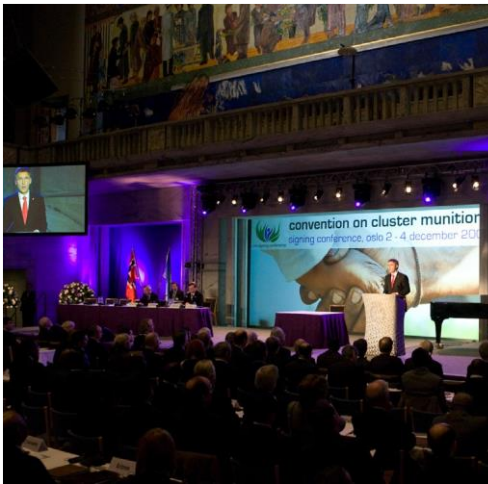
ກອງປະຊຸມລົງນາມໃນສົນທິສັນຍາວ່າດ້ວຍລະເບີດລູກທ່ວານ, ທີ່ ໂອສໂລ ວັນທີ 3 ທັນວາ 2008.

ໂຄງການ: ອົງການສາກົນເພື່ອຄົ້ນພົບການໄດ້ຈັດຕັ້ງປະຕິບັດໂຄງການ 4 ປີ (2009-2012), ເຊິ່ງໄດ້ສົ່ງເສີມຄວາມຮ່ວມມືຂອງບັນດາປະເທດທີ່ກຳລັງພັດທະນາ (South-South cooperation) ກ່ຽວກັບການຊ່ວຍເຫຼືອຜູ້ເຄາະຮ້າຍໃນຂົງເຂດອາຊີ ແລະ ອາຊີຕາເວັນອອກສຽງໃຕ້, ອາຊີຕາເວັນອອກກາງ, ອັບຟິກາກາງ ແລະ ຕາເວັນອອກ ແລະ ອາຊີກາງ. ກອງປະຊຸມການຊ່ວຍເຫຼືອຜູ້ເຄາະຮ້າຍລະດັບພາກພື້ນຈຳນວນ 4 ຄັ້ງໄດ້ຖືກຈັດຂຶ້ນເພື່ອສົ່ງເສີມຄວາມຮັບຮູ້ກ່ຽວກັບການຊ່ວຍເຫຼືອຜູ້ເຄາະຮ້າຍ ແລະ ຄົ້ນພົບການໃຫ້ກ້ວາງຂວາງຂຶ້ນຕື່ມ, ເພີ່ມທະວີຄວາມຮູ້ກ່ຽວກັບວິທີໃນການພັດທະນາແຜນການດຳເນີນງານແຫ່ງ ຊາດທາງດ້ານການຊ່ວຍເຫຼືອຜູ້ເຄາະຮ້າຍ/ຄົ້ນພົບການ, ແລະ ເພື່ອສະໜອງເວທີໃຫ້ບັນດາປະເທດທີ່ໄດ້ຮັບຜົນກະທົບ ແລະ ບັນດາປະເທດຜູ້ໃຫ້ທຶນສາມາດແລກປ່ຽນກ່ຽວກັບການປະຕິບັດທີ່ດີທີ່ສຸດ, ການນຳໃຊ້ປະໂຫຍດຈາກໂອກາດຕ່າງໆ. ກອງປະຊຸມເຫຼົ່ານີ້ໄດ້ມີການເຂົ້າຮ່ວມຂອງຜູ້ທີ່ມີສ່ວນຮ່ວມທີ່ກ່ຽວຂ້ອງທັງພົດຈາກຂົງເຂດພາກພື້ນເຊັ່ນ: ຕົວແທນຈາກບັນດາກະຊວງ ແລະ ບັນດາສູນທຳລາຍລະເບີດຈາກບັນດາປະເທດທີ່ໄດ້ຮັບຜົນກະທົບຈາກລະເບີດຝັງດິນ/ລະເບີດເສດເຫຼືອ ຈາກສົງຄາມ; ຕົວແທນຈາກບັນດາປະເທດທີ່ໄດ້ມຸ່ງໝັ້ນຕໍ່ຄວາມຮ່ວມມືສາກົນ, ອົງການຈັດຕັ້ງລະດັບພາກພື້ນ, ອົງການຈັດຕັ້ງຂອງຄົນພິການ ແລະ ຜູ້ລອດຊີວິດ, ຄະນະກຳມະການອົງການກາແດງສາກົນ, ໜ່ວຍງານຕົວແທນອົງການສະຫະປະຊາຊາດ, ອົງການ ແຮງງານສາກົນ, ອົງການ ITF, GICHD, ICBL ແລະ CMC. ກອງປະຊຸມລະດັບພາກພື້ນເຫຼົ່ານີ້ໄດ້ຖືກຈັດຂຶ້ນທີ່ບາງກອກ, ອາມແມນ, ໄນໂຮບີ, ດາສຮັບປີ ແລະ ທີ່ນະຄອນຫຼວງວຽງຈັນ.