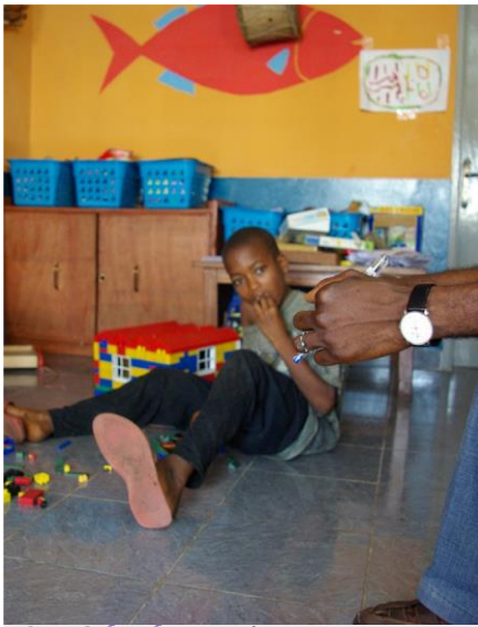
ພຣິທາວ, ຊື່ດີເຊັນເຕີ້, ເຊຍຣາ ເລໂອນ, 2007.