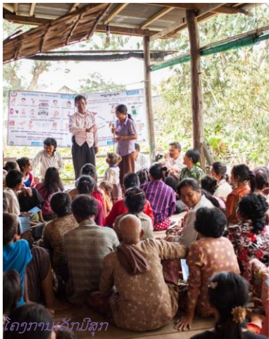
ໂຄງການເລີກມີສຸກ